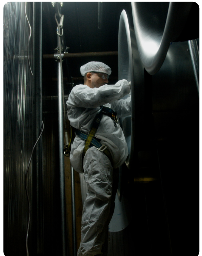
Installation af ZerAx – en kombination af menneskelige færdigheder med avanceret ventilatorteknologi

Anlægget producerer mere end 800 forskellige produktformater med over 270 forskellige ingredienser og har investeret massivt i digitalisering og bæredygtighed. Målet er at blive en nul-emissionsfabrik med avancerede digitale løsninger inden 2030.