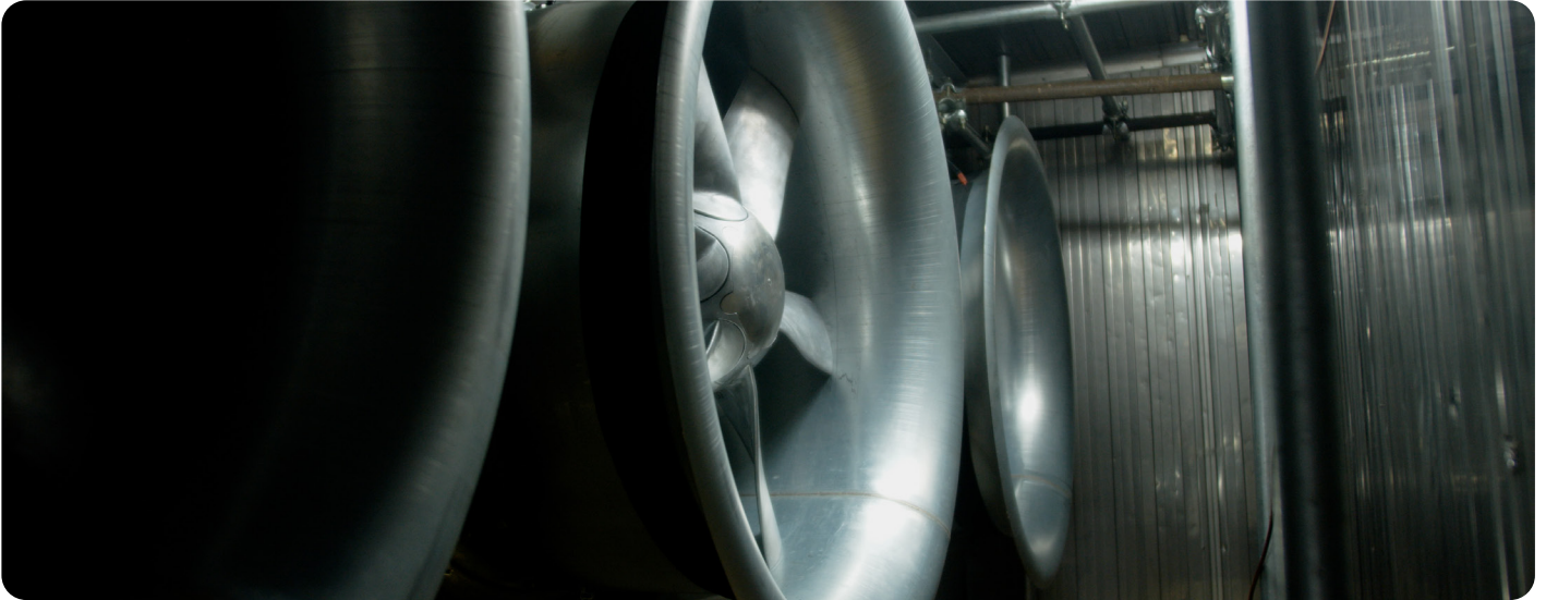
ZerAx aksialventilatorer – pålidelige ved -43 °C og med en energibesparelse på 38%