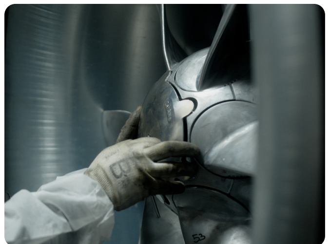
Nærbillede af ZerAx-opgraderingen