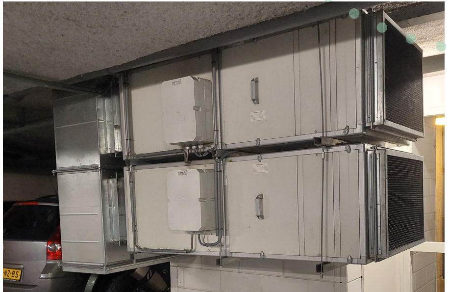
Het oude ventilatiesysteem met centrifugaalventilatoren

De upgrade biedt vele voordelen voor het ventilatiesysteem van de parkeergarage. Naast de indrukwekkende energiebesparing en de vraaggestuurde ventilatie, beschikt het nieuwe systeem over een verhoogde betrouwbaarheid en verbeterde luchtkwaliteit - allemaal factoren die bijdragen aan een aanzienlijk verbeterde algehele prestatie van de parkeergarage.