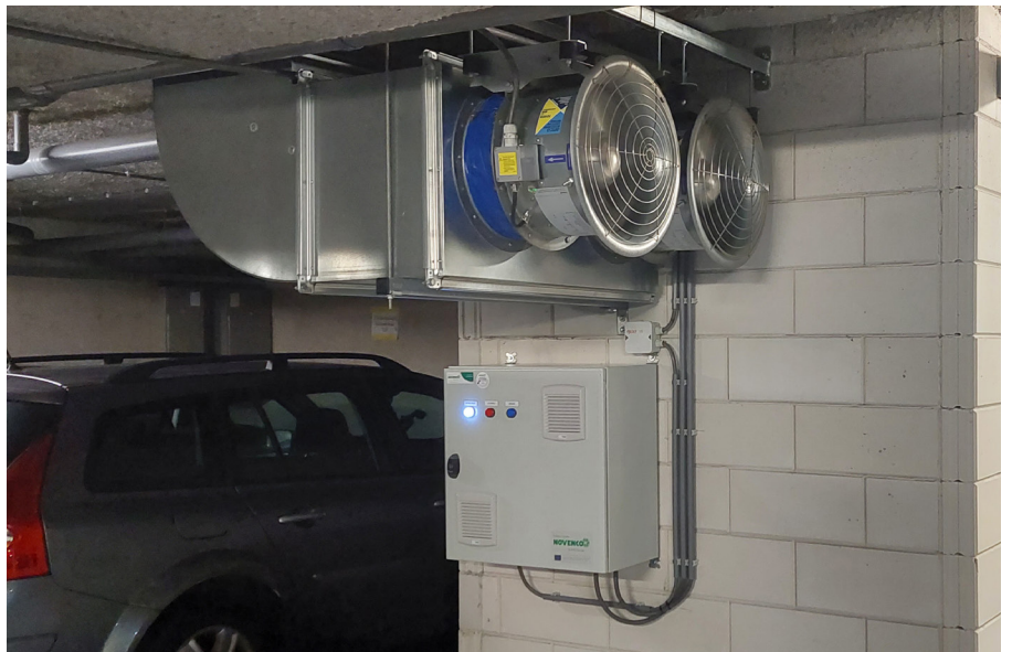
Het nieuwe ventilatiesysteem met ruimtebesparende ZerAx-ventilatoren