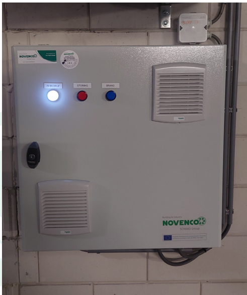
Schakelkast met frequentieregelaars en PLC besturing